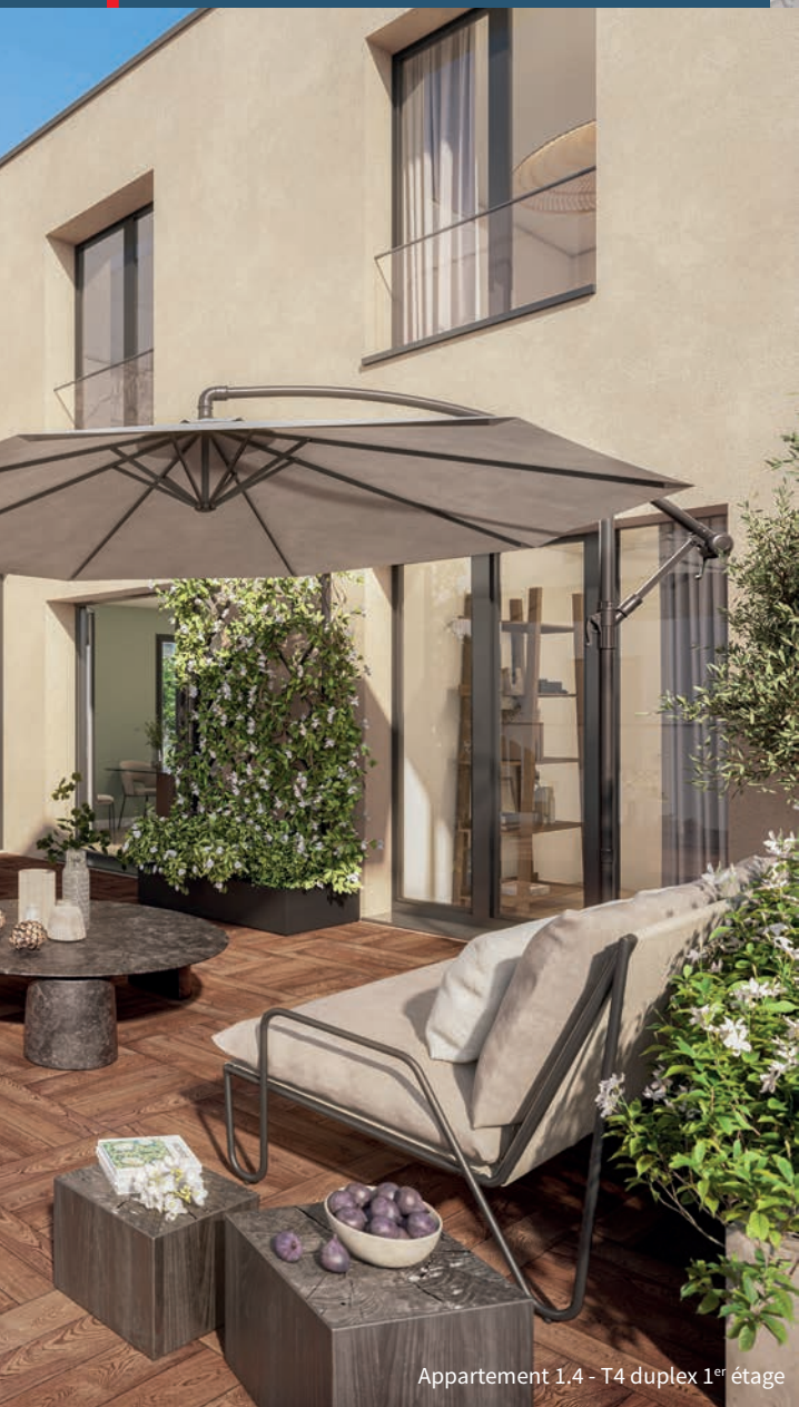
Appartement 1,4 - T4 duplex 1 er étage