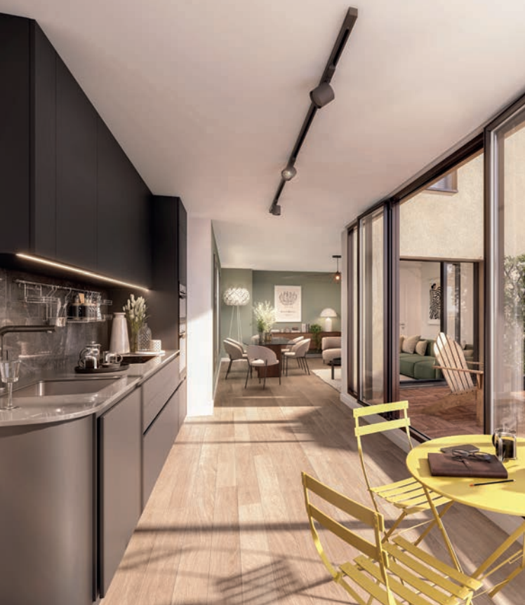
Appartement 1.4 - T4 duplex 1 er étage

Chaque appartement de notre résidence bénéficie de finitions haut-de-gamme, mettant en valeur des matériaux nobles et des détails raffinés. Découvrez une harmonie parfaite entre l'élégance intemporelle et le confort moderne dans chaque appartement.